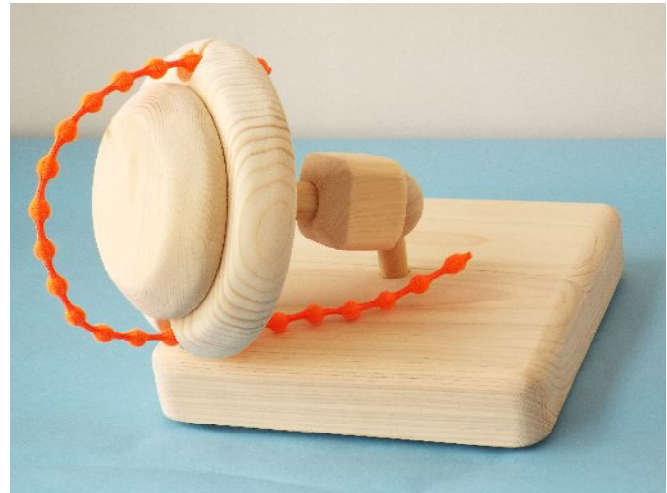
写真はグリップ大