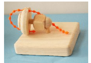
写真はグリップ小